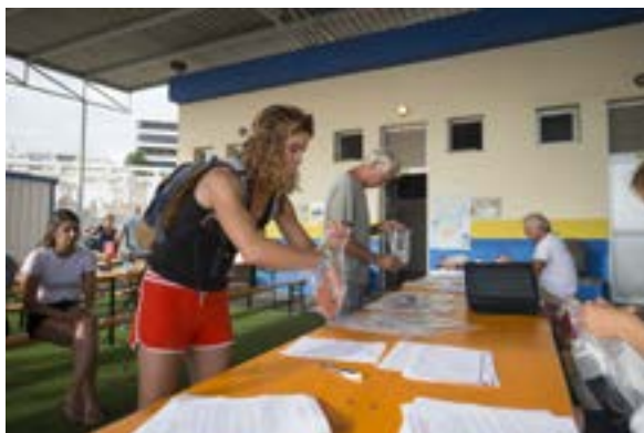
Tradition ministe. La remise des téléphones au moment de l'embarquement

Pour comprendre ce choix de la Classe Mini, il faut avant tout comprendre comment les minis naviguent.